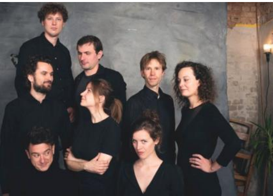
Am 05. Mai: das Ambidexter-Ensemble

Der Kinderliedersommer hat dieses Jahr endlich wieder fünf Termine und beginnt am 18. Mai mit Ratz Fatz aus dem Tirol. Am 15. Juni feiern wir mit euch 30 Jahre RITTER ROST sowie 15 Jahre BÖ & die RITTER ROST BAND.