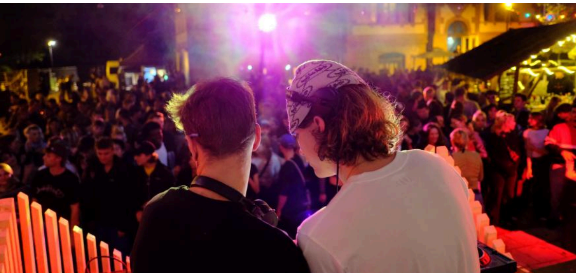
Das Drehkreuz-Kollektiv bei unserem Saison-Abschluss 2023 auf der Waldbühne

Welches Kollektiv für euch vor Ort ist, seht ihr in den Terminen und im Netz.